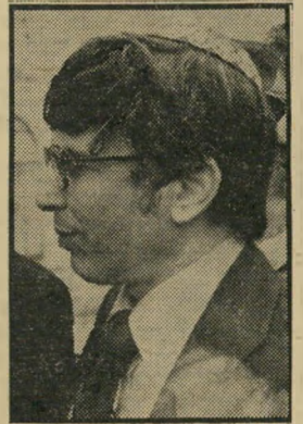
שר אבו-הצירא תיק פלסטיק

טבת הפרופסור ישעיהו לייבוז'קין : "אפילו משה דיין הוא יצור אנושי". רפי נדסון , בגלוייה מאי סיישל, לעזר וייצמן, תגיד למנהיג לא להחזיר עז שאני לא אחזור." שרי-הביטחון עזר וייצמן , על אריק שרון: "וא-"