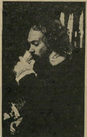
שקספיר: קורי שעה: 10.25