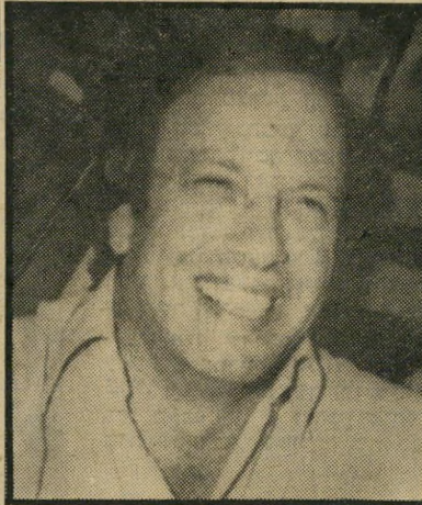
מנהל נוסע צוקרמן ההפגנות לא עזרו