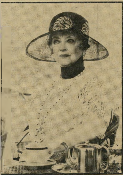
בט דייוויד ניבן, רצח על הנילוס" שטיח אדום לגברת —

ומעל לכל, במט דייוויד, לא היה כוח בעור-לם שימנע ממנו להצטרף למסע. ויותר מכל בט דייוויד משום שהגברת, שהיתה הדיקנית של צוות השחקנים ב-רצח על הנילוס, היא אחת האגדות החיות של עולם הסרטים. שחקנית דרמטית ש-הצליחה בזכות כישרונה, בתקופה שבה היופי היה חשוב יותר לעירי-הסרטים מן האופי. היא היתה במשך שנים ארוכות האטרקציה העיקרית של אלפני וורנר, דמות בלתי-נשכחת בסרטים כמו בכבלי אנוש ואלזבט ואסקס, פעמיים זכתה בפרס האוסקר, ואחת הדמויות הסוערות ביותר שידעה הוליווד אי-פעם. היא לחמה בחי-רוף-נפש על תפקידים ועל בני-זוג ל-מישחק, ועד היום עוד מתהלכת האגדה כי סירבה להופיע בחלף עם הרוח משום שהתנאי לכך היה שארול פלין יופיע מולה.