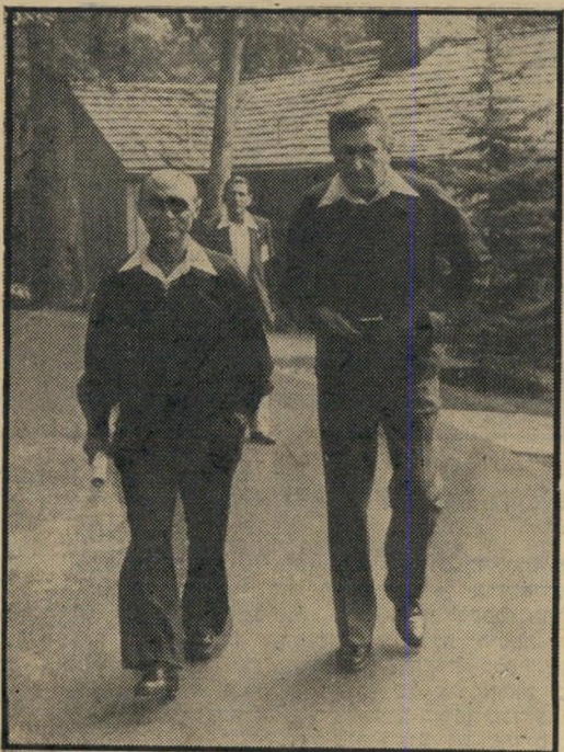
עזר ודין בקמפידייוד

שובבותו המפורסמת, טיבעו הפתוח, כישרונו להשמיע בסרט הנע אימרות-שפר והשמצות, אייכולתו המוחלטת לסתום את הפה שלו, הייצר הדוחף אותו לבטא את דעתו גם כשהוא יודע שהיא תרגיו ותקומם את הממונים