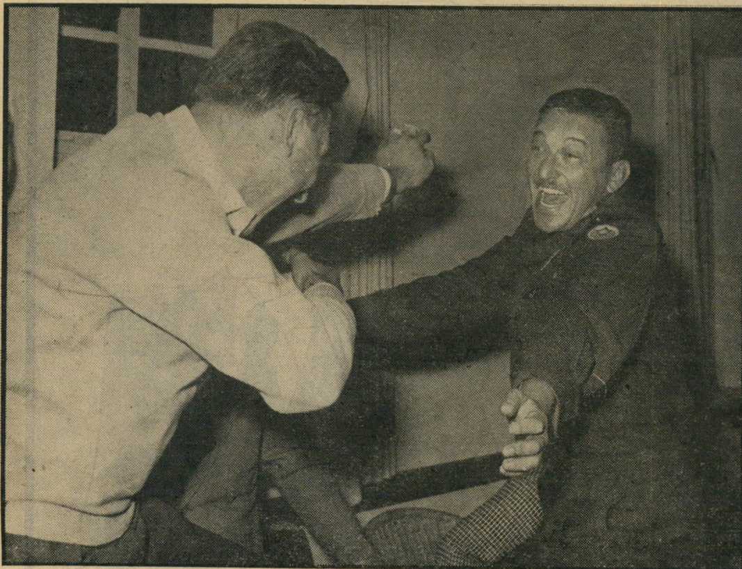
מפקד חיל-האוויר: עזר בחנועה אופיינית, מול חברו יוסף קדר, מנותקי החיל

זה בא לפתע פיתאום, בדצמבר 1969. בגיל 45 הפך האדוף עזר וויצמן, בן-לידה ממש, מחייל