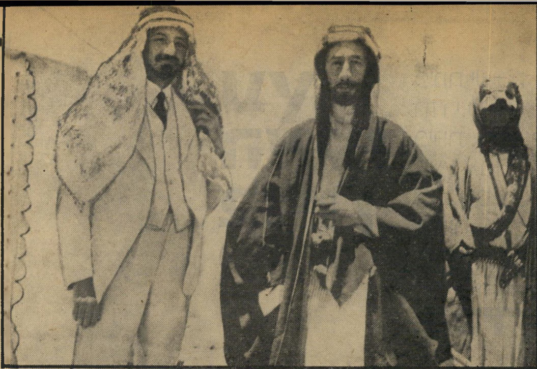
הבגישו ההיסטורית של חיים וייצמן עם האמיר פייצל ליד עקבה (1918)

כאשר בא הדוד חיים לבקר בבית המישפחה, ברחוב מלצ"ט 4 בהדרה-הכרמל, בשכונה האריסטוקרטית של חיפה דאז, הביא עימו משב של אוויר צח מהעולם הגדול, ממקומות כמו לונדון, פאריס, ניו-יורק. הוא גם הביא עימו את האגדות של חייו הפוליטיים, את פגישתו במידבר