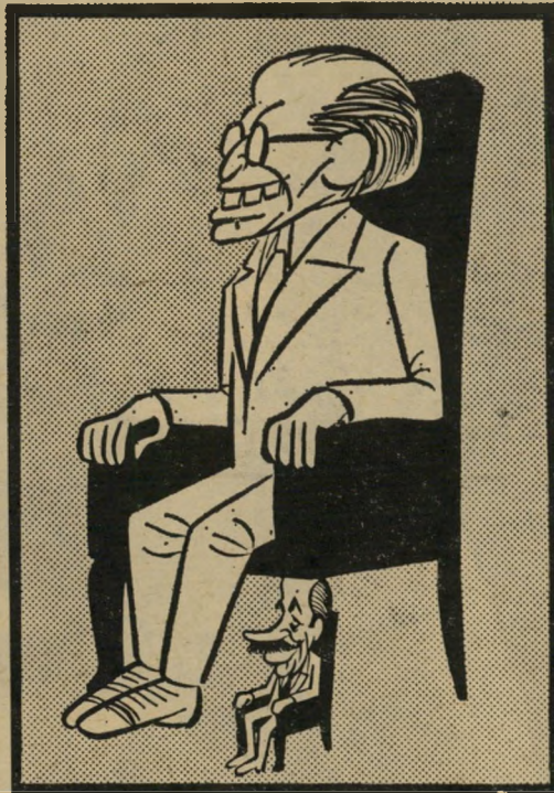
קאריקטורה של זאב ב, הארץ

דווקא בענייני-פנים, שתודת להם הגיע לשילטון, חסר הליכוד מנהיגות כלשהי. הוא לא היה מסוגל לבצע