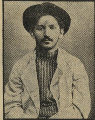
ברל כצנלסון (1903)

על פיו לעיני הקהל בן-האלפים. זה היה האות. מיד קמו הפקידים ממקומותיהם, הם הקפזו את כוכבא. אחרים מהם גם הם מילאו את פיהם רוק וירקו בו. אחרים התכופפו, הרימו מן הקרקע גוש חול מורי-מב מן הגשם וזרקו בפניו, על כתפיו, על ידיו. פניו של כוכבא היו כבר מנומרי-רים בכרך, בשערור דבקו גלדי כוץ, על חולצתו השחיר כוץ מעורב ביריקות... למה אתם שותקים? התלהב מלואפוס 'הנה הישנא שלכם' — 'המשוגע הזה! הוא מדבר על אפונכם! הוא רוצה כאי-שונכם! עתה ניגשו גם אחרים מן החלוי-צים, מן הספלים האחרונים, הרימו גושי עפר, וזרקו, כמעשה מנהיגיהם... סוף סוף זו כוכבא ממקומו. הוא התחיל לרדת מן הכמה כצעדים כושלים, כשפניו מוכוסים בכוץ מעורב ברוק וכדם — מגוש עפר