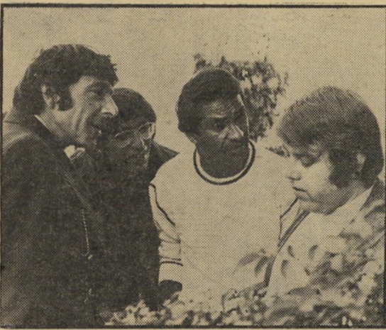
חזקה, מיטלפונקט ורווח נוי — מי האב?

ואילו השאר הם יוצאי אירופה. הפשטה זו בחלוקת הדמויות נמשכת בשלבים רבים גם במינבה העלילה. אבל מה שמצויל, בכל זאת, את הסרט, זאת הכנות ובעיקר האימוק, המפתיע אצל רווח. אם ימשיך כך, אולי יצמח בישראל הבמאי העממי הראשון.