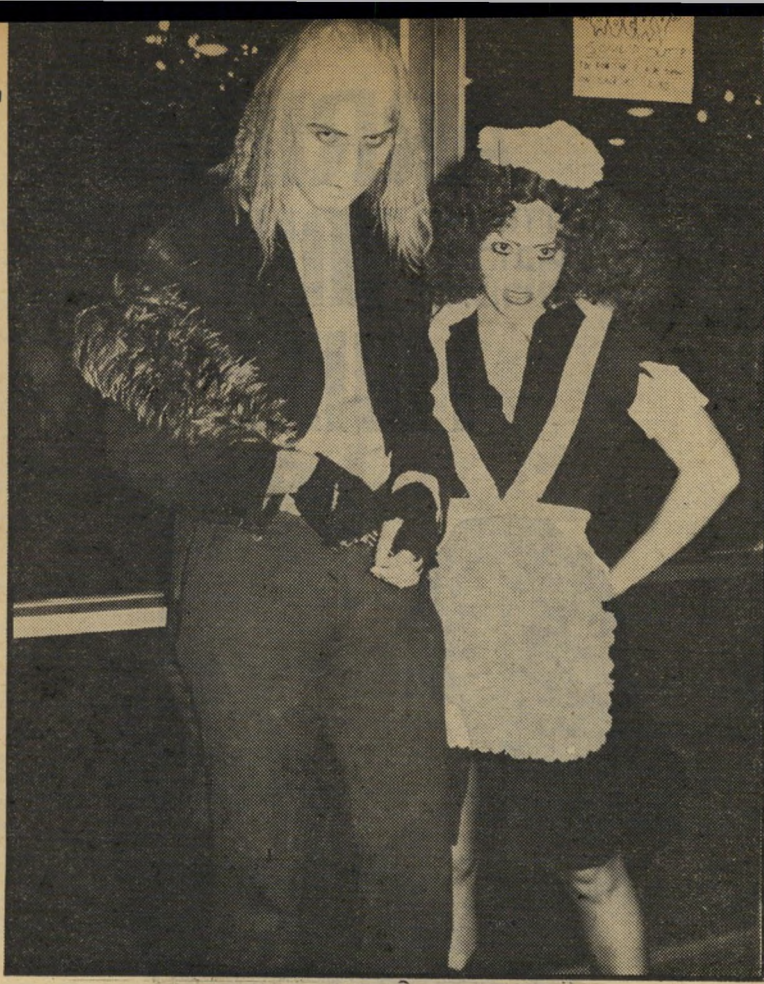
צופים מהופשים בכנפי המשרתים בסרט האימים מציתים בוטרים באולם

ההמתנה הארוכה בפתח הקולנוע אינה משעממת. קבוצות מגובשות של נערים ונערות מגישים תוכנית מאולתרת, הצגות רחוב ומערכונים דימוניים. דקות ספורות לפני הצות נפתחים הר שערם וכולם זורמים פנימה. ואז זה מתחיל. את השורה הראשונה תופסת מיד הקבוצה הצבעונית המחופשת. מן הרמקולים המצויים לצידו הבמה בוקר עם צילי הסרט. כדאי לציון כי הסרט מוסיקלי ומלווה בשירים רבים, בעיקר בסגנון הרוק. התקליט, שהוצא עוד לפני שנתיים — נחטף. הקבוצה המחופשת ל גיבורי הסרט, הכוללת כ-30 איש, עולה לבמה ומתחילה לרקוד, כולם ביחד בקצב אחיד ומדויק. נראה כי הצוות מוכן וערך