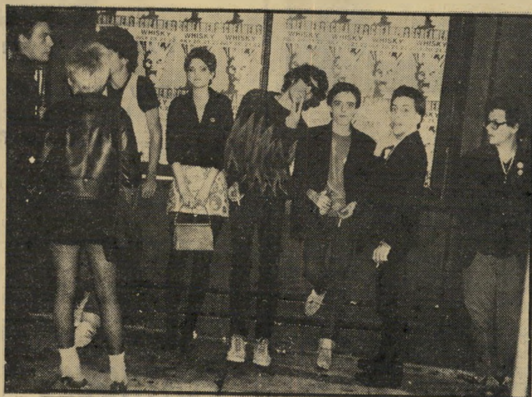
חבורת צעירים ליד מועדון רוק בשדרות פאנסט כמו במסיבת פורים

האם רוקי — סרט אימים וקולנוע טיפאני בלוס-אנג'לס הינם פתח לשינוי משמעותי בתולדות הקולנוע? האם נפתח עתה עידן חדש שבו הקהל הינו חלק בלתי נפרד של היצירה הקולנועית? בשלב זה קשה לענות על השאלה. אולם התופעה נמשכת.