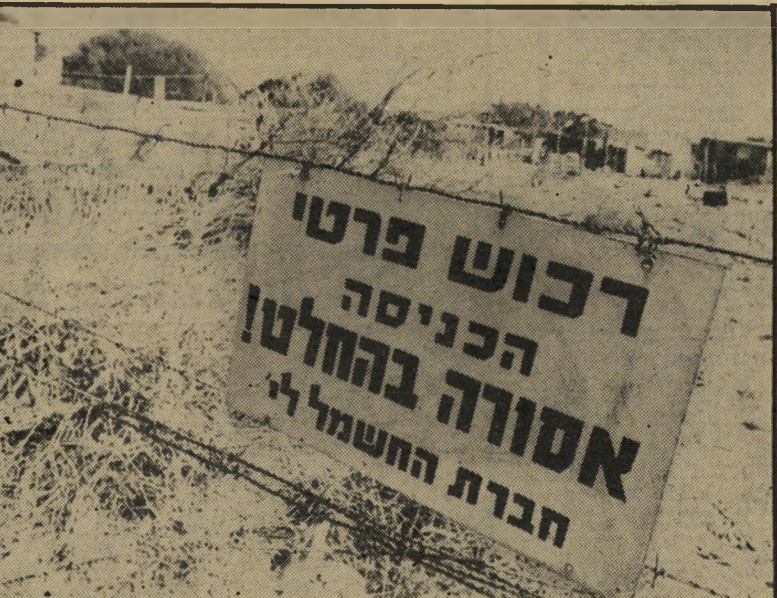
החסימה בכניסה לכפר, זורקים אותנו לרחוב!