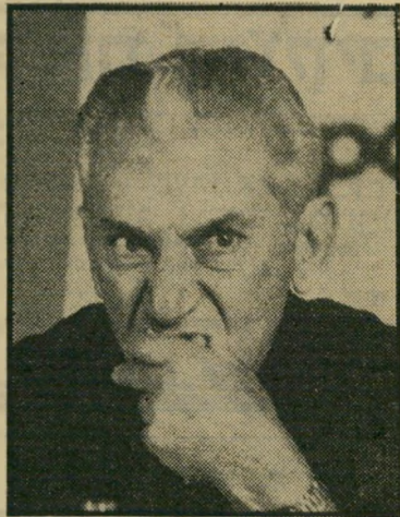
חיים בר-לב מדהיר מחיר

ספק רב אם עקרות-הבית המבקשות לקנות בשר תרנגולי הודו, ונדהמות כאשר יודעות מהן 100 ל"י לק"ג חזה הודו, גבוה זה למי ששימש בשעתו שר המיס-חר והתעשייה, ח"כ המערך חיים בר-לב.