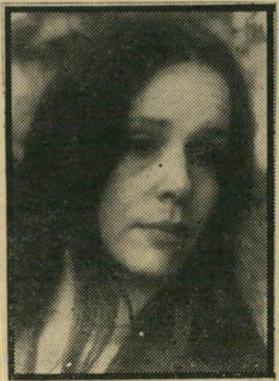
השכמה: אזווין שעה 10.00

רים שהחליטו לחזור למוטב ולא תמיד מצליחים בכך.