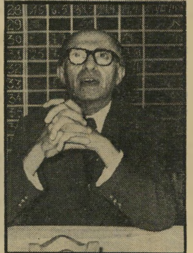
ראשי-הממשלה בגין בג'ורג'יו: הוא יביא להרס המדינה