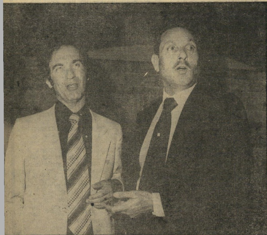
שר מודעי ומנכ"ל אדמון חלוקה פרופורציונאלית