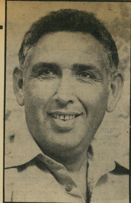
תחילת אלוף (מ.ל.) אריה קרן