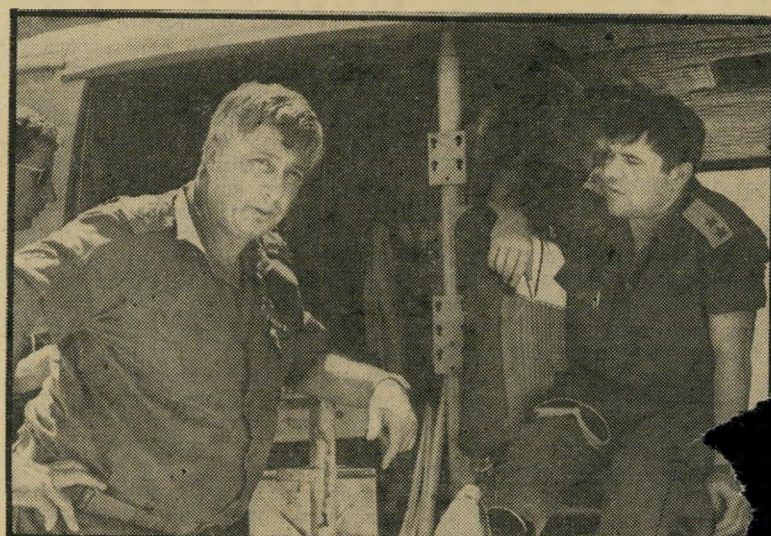
נתקה (בסגני-אויף) במידחמת ששת-הימים עם אריה קרן

שחלו את כרוזת הרשימה העל-מיפלגתית למען אשקלון, שבראשה עומד קרן, בהי-לונות-הראווה של חנויותיהם. קיבלו אותם גם מישפחותיהם של אלה שהביעו בגלוי תמיכה בקרן, או נרתמו למסע הבחירות