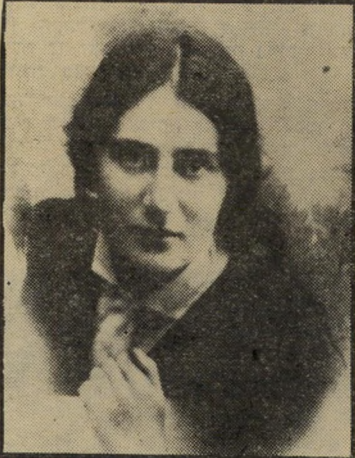
משוררת רחל מבריקה רעיונות על שירת האדם