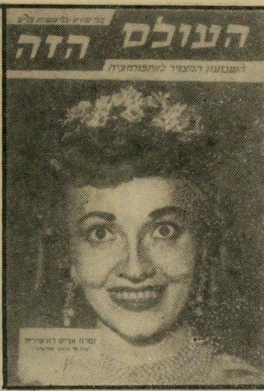
דהפיליפ בשער "העולם הזה" בלי מורא ובלי משוא פנים

קריאת הסיפור, מכוונת כותרת-המישנה לגרות את הקורא לקרוא את הסיפור שהיא קשורה בו. כדי שתשיג את יעדה זה היא צריכה לכלול את הפסוקים יוצריה-מתח ומגריה-קריאה המופיעים בסיפור העיתונאי. בעוד שכתיבת "הכותרת המסבירה" מורטלת, בדרך כלל, על כותב הכתבה שבה מופיע הצילום, הרי שאת מלאכת כתיבת כותרת-המישנה, "המגרה" עושה עורך-הכיתוב. אחרי שהחומר הכתוב מגיע לידי ועובר לבחור מתוכו את הפסוקים הנראים לו כמושכים ביותר, תפקידו הוא להוסיף אותם ככותרת-מישנה לכותרת הראשית של הצילום.