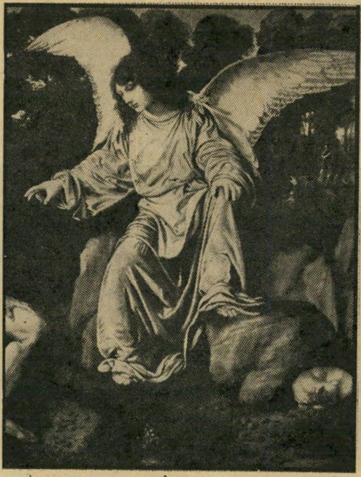
המלאך צלצאל: כל הקווים תפוסים

כך או כך — הוועידה תסתיים, האבק יתי פזר, הגיבורים יחזרו הביתה. ועל עמי-ישראל יהיה, בדבריו של עזר וייצמן לפני שנה, "לשים את הראש תחת כרו המים הקרים ולחשוב".