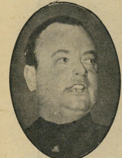
אנתון מוזרט הקוויזלינג ההולנדי

מיעוטים לאומיים ולרכוש את נאמנותם. העם היהודי, בעניין זה, טרם יצא מהגלות ומהגטו, גם כשמדובר על דור שלישי של ילידי הארץ. המייג'רים סעד חדאד וסאמי שידיאק, שיצאו להגן על בני עדתם בדרום-לבנון, זוכים אצלנו בתואר "קוויזלינג", כאשר "ממשלתם ה-חוקית" בבירות משתפת פעולה עם הסורים, הטובחים בגלוי בבני-עמם. אם נישאר נאמנים להגדרה המקורית של "קוויזלינג" — היכן משתפים חדאד ושידיאק פעולה עם אויב עמם? האם ישראל היא אויב הלבנונים? האם ישראל קבעה לעצמה, אי-פעם, כמטרה, להשמיד או לשעבד את העם הלבנוני? האם התואר "קוויזלינג"