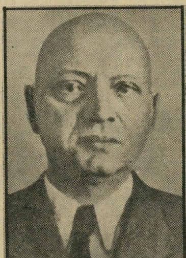
עמנואל מוראוויץ' הקוויזלינג הצ'כי