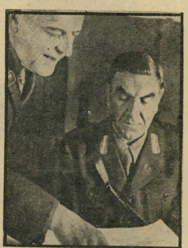
אנטה פאווליץ' הקוויזלינג היוגוסלבי

אינו מתאים בדיוק לאלה הנקראים "הממשלה ה-חוקית של לבנון"? שליטי ערב מתפרנסים, מזה שנים, בשוק הפוליטי, מהצגת ישראל כאויב הערבים. אנו יודעים שאין ל-ישראל כל מטרה לפגוע, ביוזמתה, בארץ ערבית כלשהי. מכאן — שמתף-פעולה ערבי עם ישראל אינו — מעצם הגדרת המושג — להיות "קוויזלינג", הפועל ב-שירותו של אויב, נגד עמו שלו. מדוע זה יהודים להוטים כליכך לאמץ נוסחאות של אויביהם (האמני-תיים), לפני שיחשבו לרגע, בראש צלול, על מעמדו וזכויותיו לפעול כמדינה ריבונית, שאינה דוחה בני עמים אחרים המוכנים לעמוד לצידו?