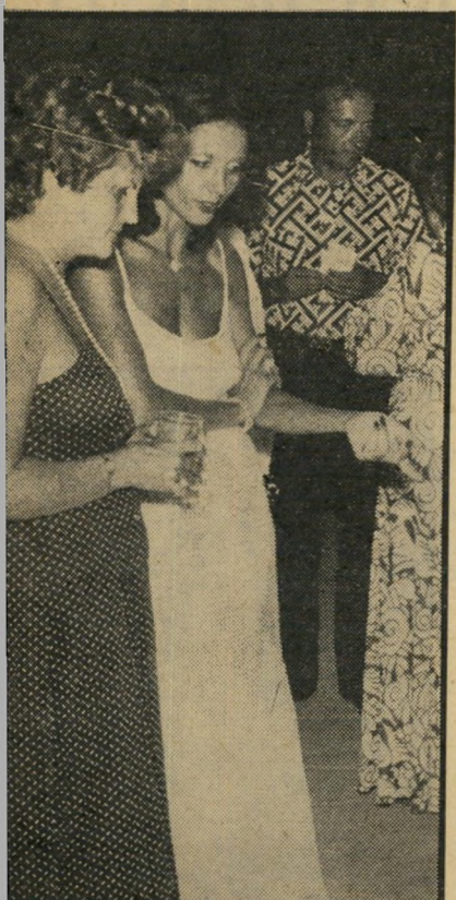
זוהה להט עם אנט ** "לא דיברתי!"