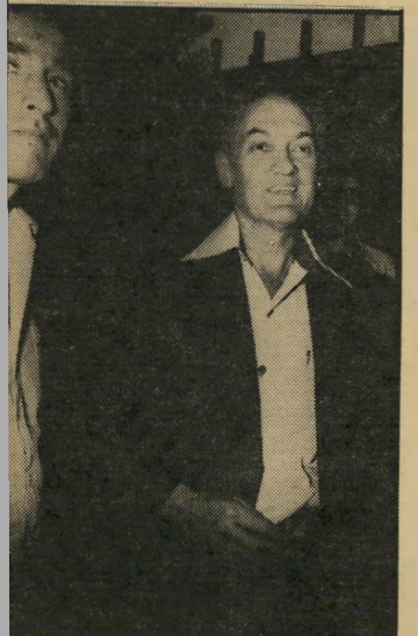
מועמד ליו ועוזרו "אין לי מקורות אחרים!"

פלאטו-שרון הוא נעצר על-ידי המישר טרה. כששוחרר, הודיע פלאטו כי הוא רק לכנסת. הוא עשה כן ואף נבחר. צ'יצ' נבהל מרעיון ההנצחה של פלאטו ומהבני קורת הציבורית שתוטח נגדו כאשר הדבר יתפרסם. הוא ניצל את העובדה שהעירייה עדיין לא חתמה על הסכם ההנצחה ו"שכח" ממנו. שלא כמינהגו, לא היה