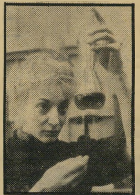
מאדאם קירי: דהיקומיורי שעה 9.20

● מארי קירי (9.20) אחרי שני פרקים אפשר לקרר בוע, כי סידרה זו היא מן הדי טובות שהוקרנו בטלוויזיה. הי סידרה שונה לחלוטין מהסרט מארי קירי שהופק לפני 35 שנה וזכה בהצלחה קופתית גדולה. במאי הסידרה, ג'ון גלניסטר, ביים באחרונה גירי