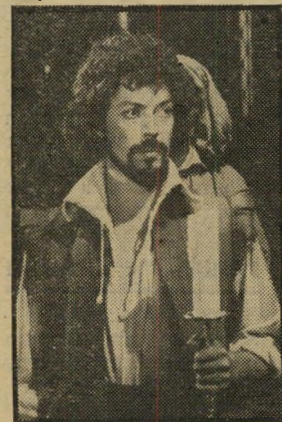
שקספיר: קורי שעה 10.00