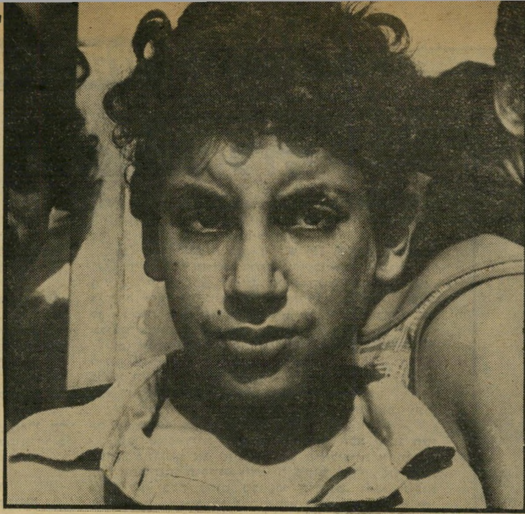
עזתי טושי לא איכפת לי כמה משלמים!"

כשראו הפועלים הערבים, שעסקו במיי לוי מיכלי עגבניות, את אנשי שרותי התעסוקה, נשאו רגליהם ונעלמו בין השורחות. שלושה אנשי השירות, כולם בגילי העמידה, ניסו לדלוק אחריהם, אך לשווא. כאשר פנו אל ציון, בנו של בעל-השדה, התחיל הלה לקלל ולאיים: "אני אשרוף לכם את המכונית!" הצעיר השחרחר והר גבוה, בחולצה פתוחה ומכנסיי-עבודה צב-