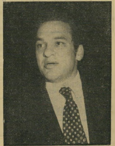
נמט רונן מרכז תפוז

בשידור נטען ששני צלמים ערביים צילמו את התמונות, ושמותיהם אף הובאו. אולם מאוחר יותר התברר כי הכתבה