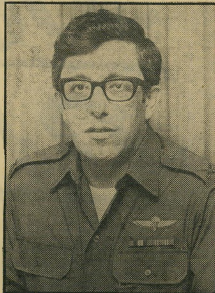
קפ"ר מיכאלי קרפור - סתימת חורים

ארבע ניידות משוכללות, עם כל הציוד הדרוש לריפוי שיניים, מוגני-אוויר ומצי למות רנטגן, נרכשו בגרמניה והוצבו בבסיס סיסי צה"ל מרוחקים. גם דרגות הוענקו בשפע. בעוד שלפני 20 שנה היה רופא