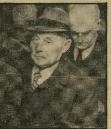
קרפ"ר-רשעבר עצמון החפירות התחילה

אם לחייל, שבינתיים יכול להשתגע מכאבים, יש מזל, הרי שהוא מגיע למיר-