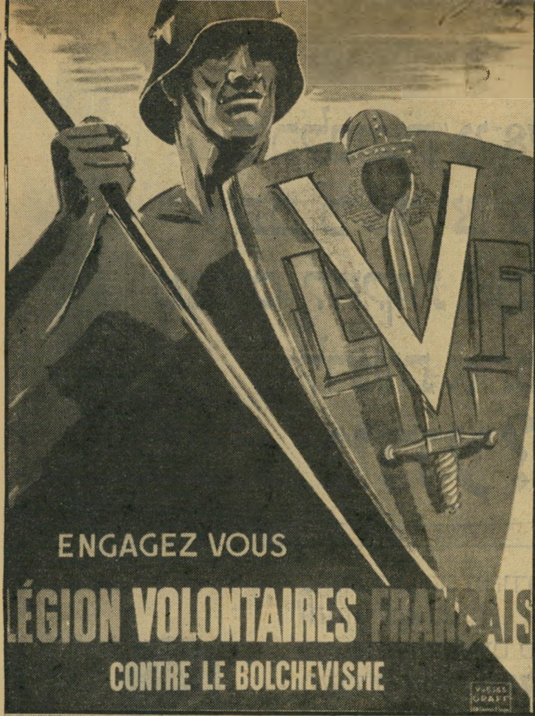
כרוזה של פטן ג'וריס חיילים לדגון הצרפתי כצבא הנאצי טוכן גרמני

את התפקיד הקלאסי של מעצמה, או מיני מעצמה. היא מנהלת "פוליטיקה ריאליזם" בהתאם לאינטרסים המידיים שלה. היא מגישה לנוצרים סיוע צבאי, מדיני ואידיאולוגי, מתוך תיקווה שבכך יוחלש הכוח הסורי ו/או הפלסטיני.