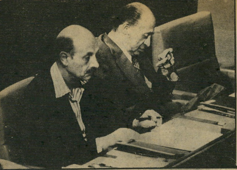
בגין וירין ברחה מן האחריות