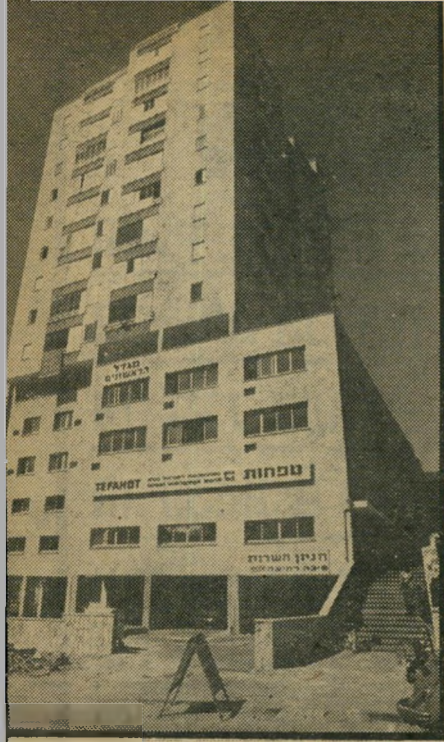
קבינו הבניין עדני חריגות במיליונים?