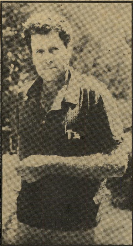
יוזם אבני „נתקענו“

הנה, למוש, הפרשה המורה והמפ קס חידה של בית-הארץ לעגבניות, שי קם במשך שדות.