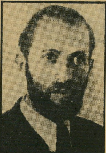
בגין קסובר עם שפס

אותו צילום ראוי לכך, וגם תוכנו הצדיק זאת. אך חששנו שמא ייראה הדבר כהתרעבות במערכת-הבחירות, והתאפקנו.