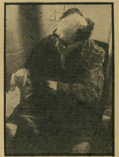
בגין קסוברו שד פן לא על השער

הבעת-פניו הצהולות-משותוללות של שחי קר-כדורגל ברגע של בעיטת השער, מבט הכאב של חייל ברגע שחברו נפצע לי עיניו, התנועה הערמומית של פוליטיקאי