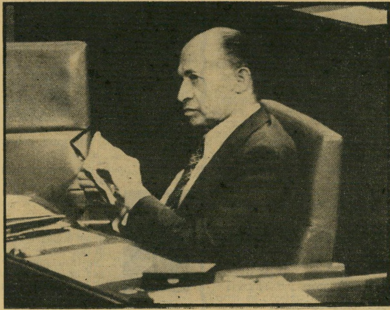
— זמנקה אותם כוונות זדון?

פן, אל בית-החולים ישבו היה בגין מאושפן, ערב הבחירות, והנציח את פניו הצנומות, שגילו בבירור את עיקבות התקף-הלב. לתמונה זו (העולם הזה 2066) היתה לדעת כל בעלי-הדבר, השפעה ישירה על מערכת-הבחירות. היא אילצה את מנהלי המערכת מטעם הליכוד לשנות את הקו