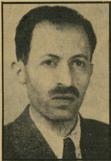
בגין קהניגסהופר בלי מישקפיים