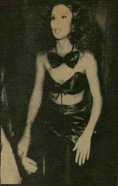
פרפר שרית דמיר, במכנסי "ה" מראה הגברי, בחזיה מ" המראה הנשי ובפרפר מהמראה השובבי.

כתב על כך השופט גילעדי בנימוקיו: "...אני סבור שכונתנו של עזרא אלפי היתה לברות מהמקום. נסיעה לאחור לא היתה מעשית. נסיעה כזאת מעצם טבעה היא איטית. אם היה הנאשם מתחיל לנסוע לאחור, סיכויי בריחתו, כשמולו שוטר — היו קלושים. אלפי גם לא יכול היה להמשיך ולנסוע ישר מולו. שכן האסקורט המיסחרית חסמה את דרכו. הוא שבר איפוא את ההגה שמאלה והחל בנסיעה. לידו אמנם עמד השוטר איבגי אך הנאשם התעלם ממנו מתוך הנחת שהלה יקפוץ לאחור כפי שאמנם עשה... לא אוכל להגיע למסקנה שהיתה לאלפי כוונה לפגוע ב- (המשך בעמוד 54)