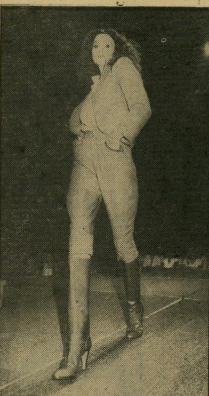
פרשית דוהרת על המסלול ב" מכנסי-רכיבה עד לבר" כיים, עשויים מצמר, ולרגליה מגפי-עור.