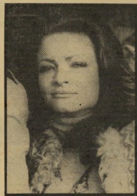
האחים: או'מרה שעה 8.00

● האחים (שעה 8.00) . לגינפר יש בעיות של נאמר