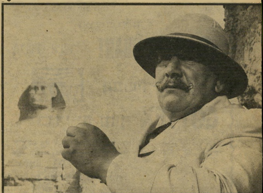
פיטר יוסטינוב ב"רצח על הניקוס" פוארי נגד הספינסט

לפרוש ולבנות. אין ספק שליון יודע על מה הוא מדבר. הסנדק ומלתעות הם שתי דוגמות שעברו את התקציב שנועד להן, אבל החברות שהיו קשורות בהפקה לא גרתעו, המשיכו, והוסיפו כספים על מה שהוצא כבר. והתוצאה לא איתרה להוכיח את עצמה: שני הסרטים עברו