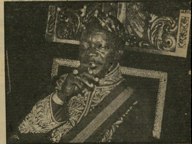
הקיסר בוקאסה ידידים בשפע