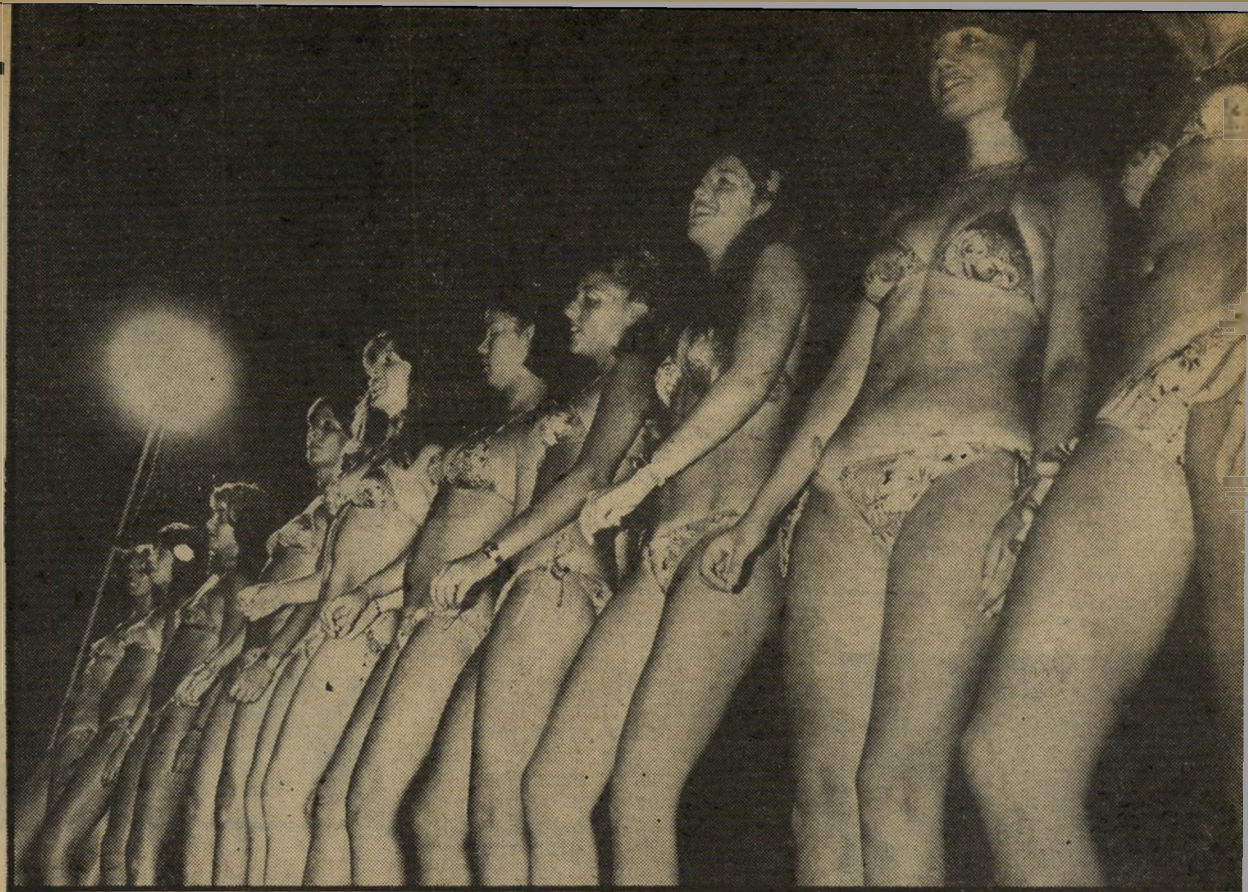
מצעד הפתיחה שלוש-עשרה המועמדות ה' סופיות בתחרות מלכת-המים '78, בהופעת-הבכורה שלהן בפני קהל בראשון בסדרת נישפי התחרות, שנערך בשבת האחרונה במלון גני שולמית באשקלון. המועמדות, לבושות כולן בביגדי-ים זהים של גוטקס, סבלו עדיין ממורא הקהל, במיוחד כשהיו צריכות לצעוד על הבמה המוארת.