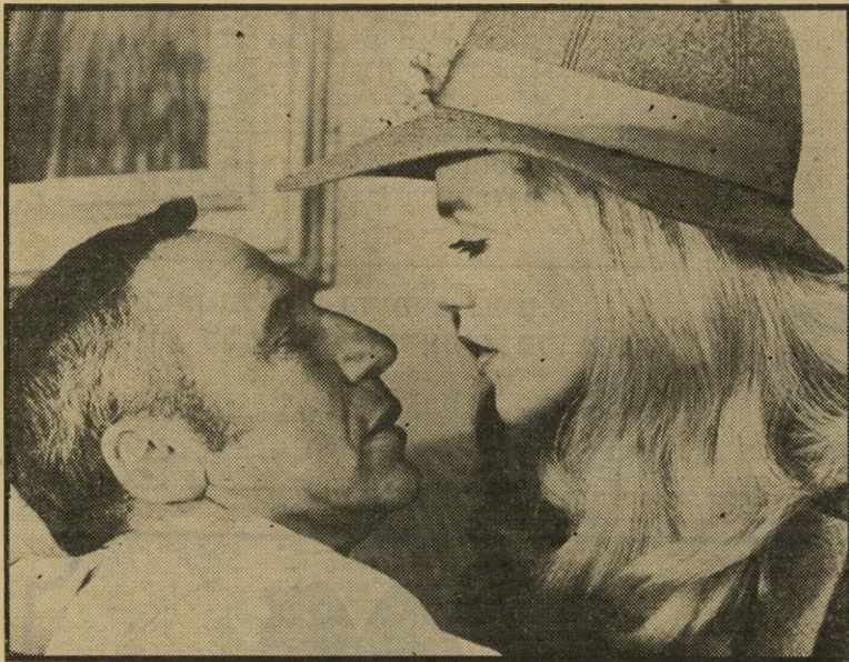
ברוקס וכוכבתיקבועה מדיון קאהן ב"פחד" אהבה מצחיקה שכזאת

נה האחרונה, שהיא העתק התיפאורה של ורטיגו על כל פרטיה. אבל ברוקס אינו מסתפק, כמובן, רק בהשאלות שקופות אלה. היציקוק קורץ לכל אורך הסרט, מן הניצוצות המגיעים אל חדרו של הפסיכיאטר מהחלון האחורי,