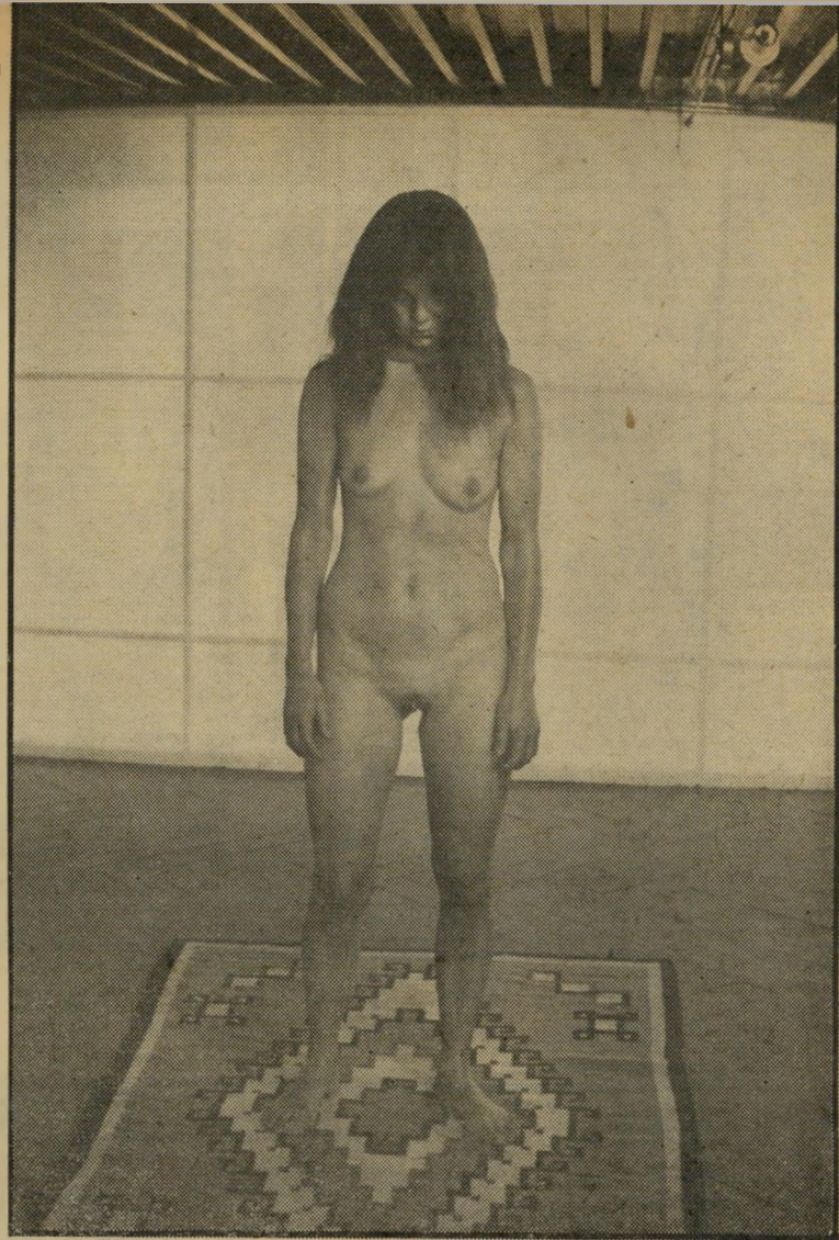
„עבודה כרטומסקיובה“ כביתן המרכזי אידויטי להינעל מאחרי מנעול ובריוח

א ם ונציה היא קצפת של עיר, הרי הביאנלה היא סופר-דופר ספאגטי. לבד מן העובדה שמטרת הביאנלה להגיש חומר ייצוגי-עכשווי, העונה על נושא של ההנהלה קובעת מדי שנתיים, הרי למעשה מהווה הביאנלה מקום מיפגש חשוב לכל העוסקים במלאכת היצירה האמנותית ובהפצתה ברבים. העונה משתתפות 28 מדינות בביאנלה, שאחת מבעיותיה היא הנושא שלה. כש-