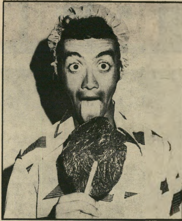
איך להרוויח חצי שעה שקט

זהו. אחרי רבע שעה ניתן לקלף בעדינות את נייר הכסף, ולתת את אוזן הפיל הזו לטרדן הקטן - אשר מיד ישעש החוצה.