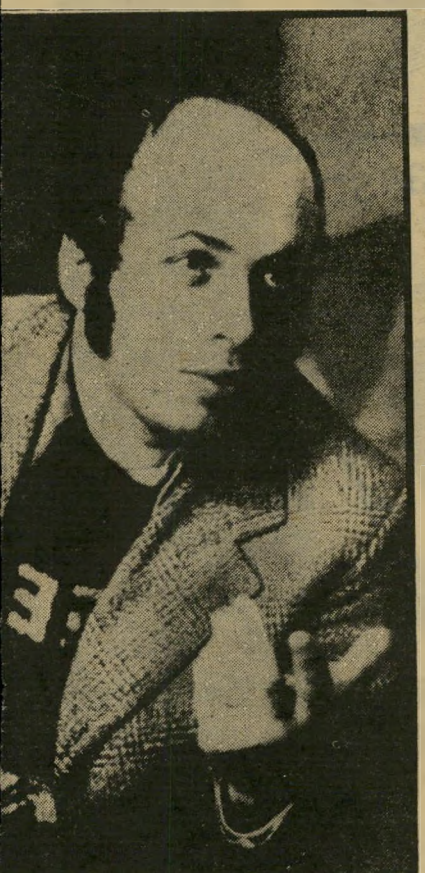
יוחם-חופש שצ'רנסקי — תוצאות שונות

על אף המחומאות העקיפות, המש-תמועות מדבריו אלה של אומני לגבי העולם הזה אני מרשה לעצמי לחלוק על טענתו. תמי. הכתבה אליה מתייחס אומני (אונס על הריצפה) לא היתה ספקדין של העולם הזה וגם לא הערכה של אישיותו ומעשיו.