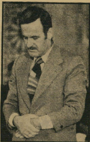
נשיא סוריה אל-אואד ניצול הזדמנות

ההרפתקה רחבת-ימורים, שאת סוף פה מי ישרו.