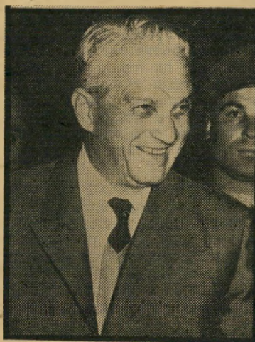
קאמיה שמעין תיקנות-שווא

לאימעטה כלפי ישראל, שעזרה להעבירם מן הפח הקטן של אש"ף אל הפתח הגדולה של הסורים.