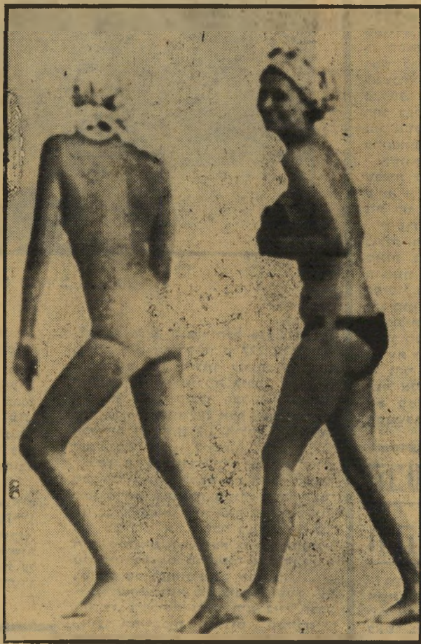
סוכייה לורן סמל הנשיות של הקולנוע הבינלאומי, צולמה בעירום באיים הקאריביים, שם היא משתפת בסרט שבו היא מגלמת את דמותה של גיימס בונד ממין נקבה. לצורך צילומי הסרט נדרשה סוכייה לורן, בת ה-44, להעלות שני קילוגרמים על מישקלה. היא עשתה זאת בעזרת מאה קילוגרם של ספאגטי, שלקחה איתה לאתר הצילומים באיים.

בישיבת ועדת־החוף והביטחון פנה משה דיין אל איש האופוזיציה, שיימון פרס, ושאל אותו: "על־סמך מה אתה הולך לדבר עם נשיא מצריים?" השיב לו פרס: "על־סמך המצע, שעל פיו נבחרנו