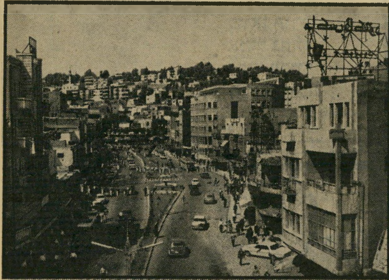
הגלויה שהגיעה מירדן למערכת "העולם הזה" פתרון לקוראים

קיים סדר עדיפות מסויים בפירסום ה' מעט מתוך עשרות המכתבים המתקבלים בדואר-המערכת מדי שבוע. במקום הראשון נמצאים אותם מכתבים הכתובים בסיגנון מקורי או מאירים נושא העומד על סדר-היום מנקודת-מבט בלתי שיגרתית. אחר ריהם נבחרים לפירסום מכתבים הדנים ב' בעיות ועניינים אישיים, שיכול להיות בהם עניין לציבור רחב יותר של קוראים. בשני המקרים ניתנת עדיפות למכתבים קצרים. מכתבים ארוכים, שלרוב הם ב'