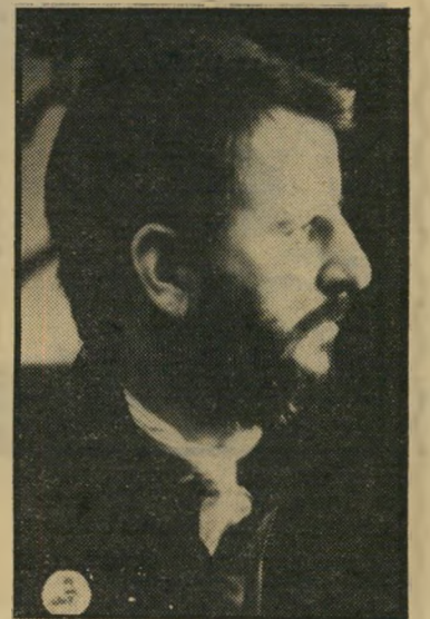
זמר רינגו סטאר התלהבות הקהל

הפופ כקורבנות של קהל תובעני שאינו שבע לעולם. סקורסזה בחר לעסוק במיבי צעים בלבד. הערצת הקהל היא מובנת מאליה, חוץ מזה שמדובר כבר באילילים בשנות השלושים שלהם, ובקהל שאינו הרבה יותר צעיר.