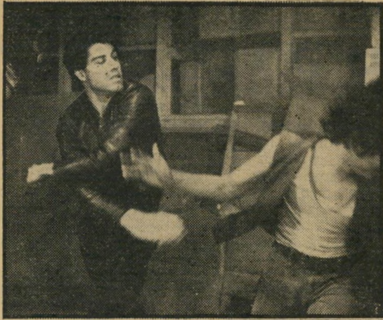
טראוולטה מרביץ — רק בזווית מחמיאה

הופכת פולחן מיני מרגש. המחולות מצביעים על הרבה מאד מרץ, אם לא על דמיון עשיר במיוחד, ובאדחם מצלם קטעים גדולים מהם כאילו הרוקדים חשובים יותר מן הריקוד. ומעל לכל, המוסיקה של האחים גיב ולהקתם (להקת הבי-ג'ייס). מקנה לסרט צביון מעודכן, קצב לוחט ושפה משותפת עם כל מי שמאזין למיצעדי הפזמונים. ואם תוסיפו לכך את עצם העובדה שטראוולטה מצטייר כמי שאכן קורץ מאבק-כוכבים, אין כל סיבה להתפלא על כך שהסרט הוא להיט-קופה.