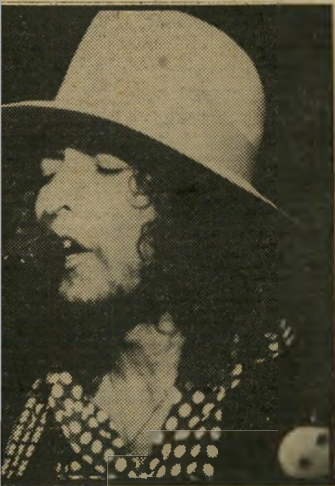
זמר כוב דיקן מסע מן העבר

ריס ומאדי ואטרס, ועוד. כולם התייצבו, מוכנים ליטול חלק בקונצרט ולהיפרד בדרך זו מהלהקה. וכך, מה שצריך היה להיות מופע חגיגי פרטי של להקת-קצב, הפך לטכס סיום של תקופה, שחתם עידן פופ שלם שהלך לעולמו.