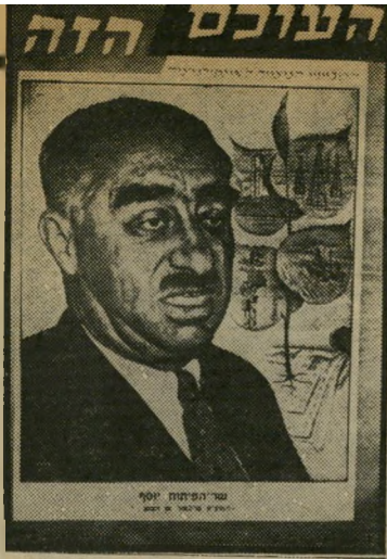
"העולם הזה" 819 תאריך: 2.7.53