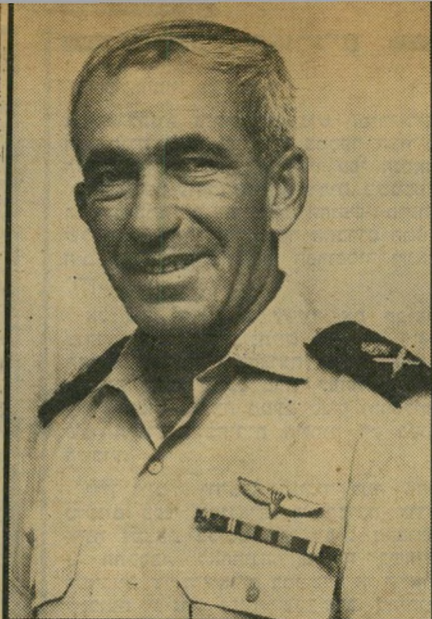
אדוף כוצר טבע