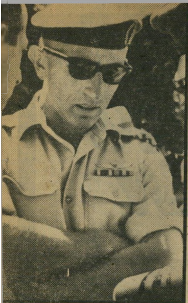
אדוף זימר נכשל