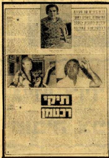
הגידויים ב"העדים הזה" (8.6.77) איוהו חוקר? המצוייד באמצעים!

למרות זאת הצליח לרכו כמה מימרים צאים, שיהיה בהם חומר כבד להחשדה.